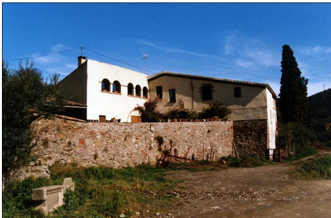
Can Vilà (2004).