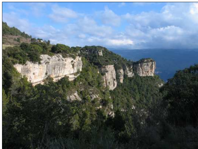
La Trona vista des de la cinglera.

8. Nieto, M.D. Llibreta de notes de la agricultura. 1786 . Fons família Barriga-Soler. Arxiu Josep Maria Cuyàs Tolosa. Edita: Carrer dels Arbres núm. ? (Museu de Badalona) 1998.