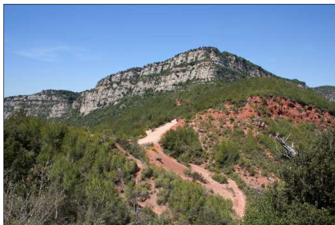
Coll de Can Tripeta amb el grau Mercader al fons a l'esquerra.

La mitjana fa el mateix recorregut fins a la Trona, però després planeja vers el nord fins al grau de Can Tresquarts (720) i davalla per la pista que condueix a Aiguafreda (415) on acaba. Són 11 km amb unes 4 h.