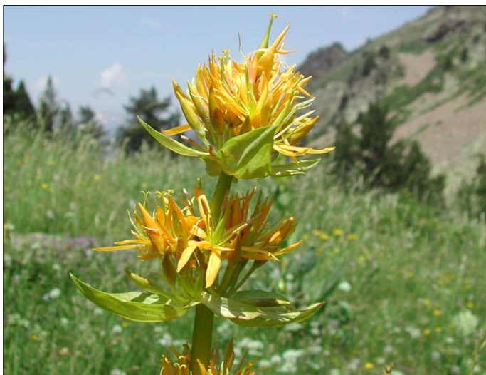
Gentiana Lutea , de la qual s'utilitza l'arrel. El glucòsid: genciomarina, es produeix amb la dessecació. Incrementa la gana, vermifug.

Puigmal i March (1878-1966) 11 , recopila receptes de la zona. Consta de 27 remeis, dels quals l'apartat de barreja de parts d'animals (pell de conill i moll de bou) i plantes són el 12% de les receptes; els remeis amb plantes soles el 52% i un 36% elements comprats a l'apotecari.