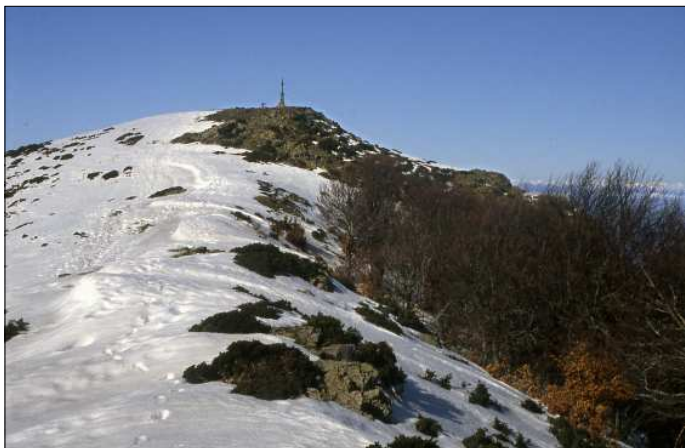
Cim del Matagalls accedint des de coll Pregon.

L'excursió llarga anirà de Sant Marçal (1.109 m) a coll Pregon fins assolir el cim del Matagalls (1.698 m). Continuarem cap a Sant Segimon, l'Erola i acabarem a Viladrau (822 m). Es tracta d'un itinerari de 14,7 km amb unes 5.15 h i un desnivell de pujada de 589 metres i un de baixada de 876 m.