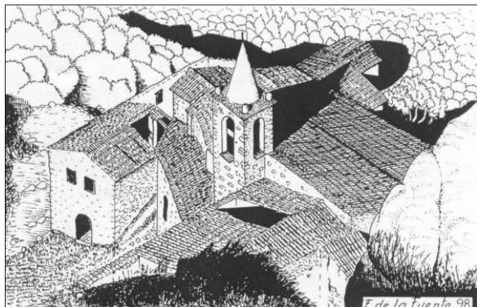
Sant Segimon des de Sant Miquel dels Barretons. Dibuix fet l'any 1998 per Ferran de la Fuente.

L'excursió llarga anirà de Sant Marçal (1.109 m) a coll Pregon fins assolir el cim del Matagalls (1.698 m). Continuarem cap a Sant Segimon, l'Erola i acabarem a Viladrau (822 m). Es tracta d'un itinerari de 14,7 km amb unes 5.15 h i un desnivell de pujada de 589 metres i un de baixada de 876 m.