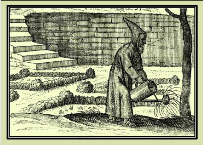
Frare regant l'hort.

En el Siràcida , llibre de la Bíblia escrit dos segles abans de Crist, un savi mestre d'Israel dedicat a la instrucció, enamorat de la llei i de la saviesa i cridat a transmetre el patrimoni religiós del seu poble a les noves generacions ens diu: