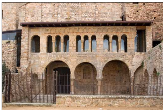
La Porta Ferrada de Sant Feliu de Guíxols.