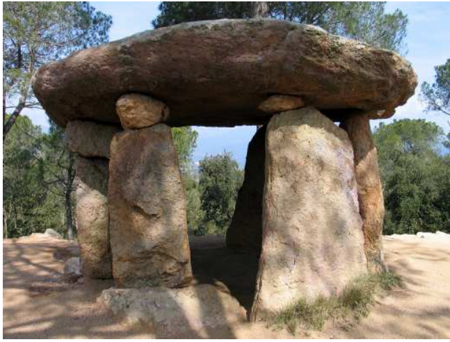
Dolmen de Pedra Gentil.

desembriuar cremant llorer beneït i resseguint amb ell tots els racons de la casa, tot portant-lo cremant damunt d'una pala. També és un bon sistema engegar trets contra els núvols amb bales beneïdes”.