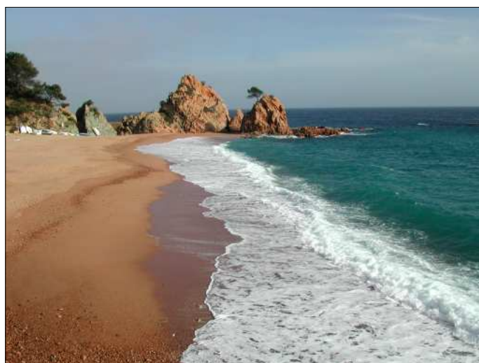
La platja de Tossa de Mar, final de l'excursió llarga.