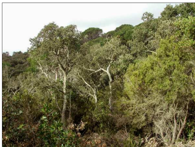
Bosc de sureres i pins pinyers amb un sotabosc dens.

L'itinerari de l'excursió mitjana serà: Sant Feliu de Guíxols, Casa Nova, pla de les Sorres, Puig Gros, coll de Portes, Sant Elm i Sant Feliu, amb un durada de 3.30 h aproximadament.