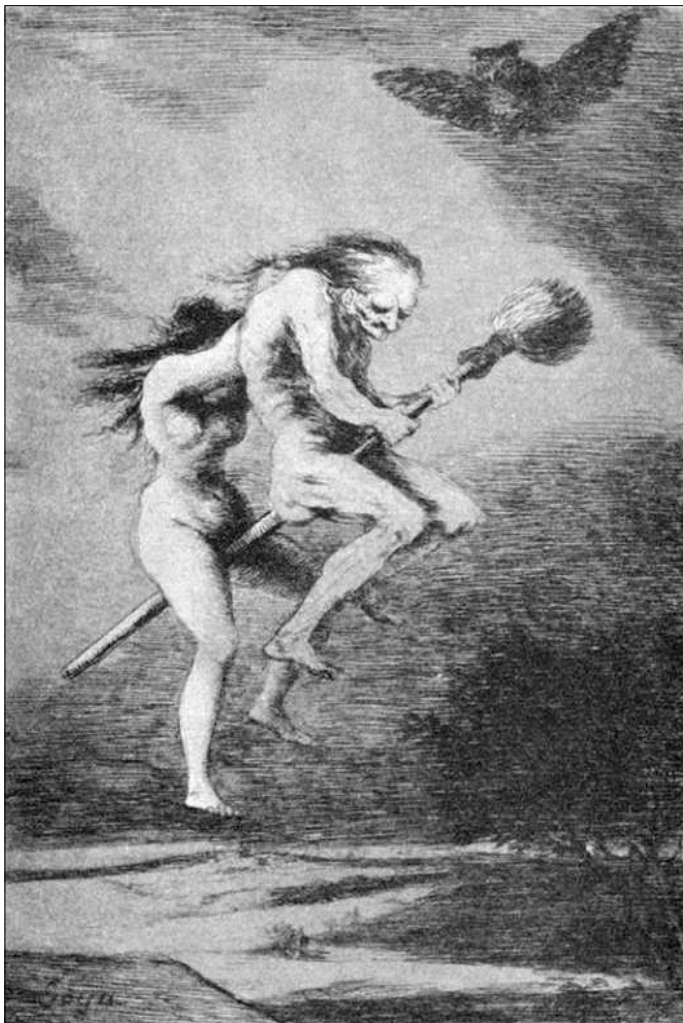
Reproducció de "La Bruja" del pintor Goya.

loides derivats del tropà, principalment l'escolopolamina, produïa al·lucinacions barrejades de naturalesa sexual. En aquestes al·lucinacions apareixien sovint dimonis i ocasionalment també sants.