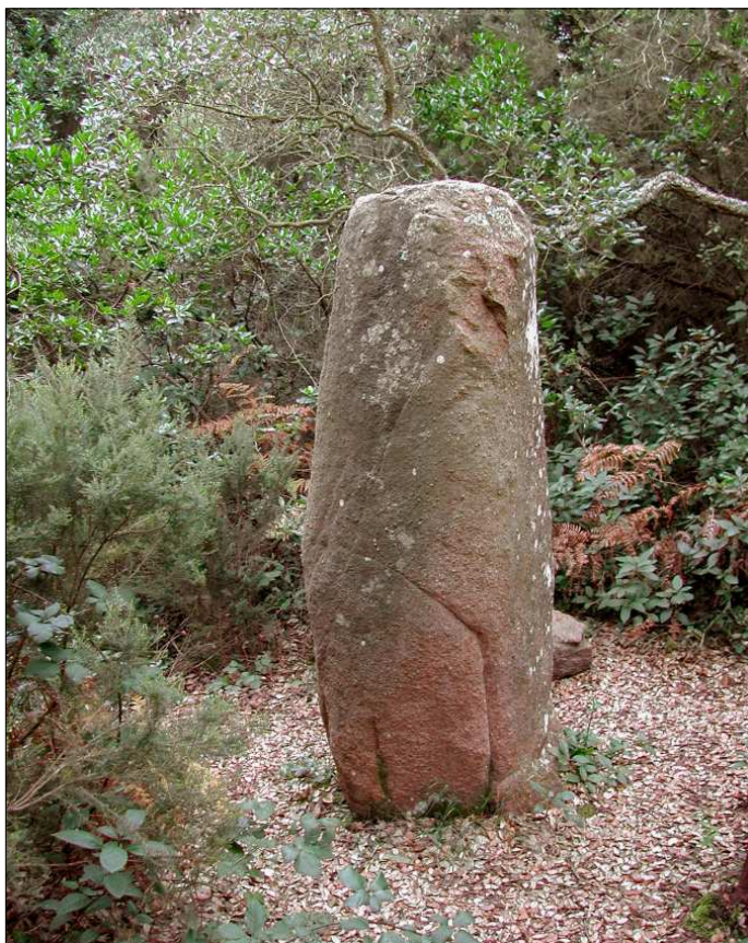
Menhir d'en Llac. Situat a la muntanya de les Cadiretes.

Passats uns minuts aparegué fum sobre el dolmen, i quan aquest es dissolgué es pogué veure el Diable amb forma de cabriol, amb unes recargolades banyes i caminant sobre les dues potes posteriors. Aquest començà a dansar sobre el dolmen tocant una gralla mentre que les bruixes, una a una, explicaven en el seu idioma, per la qual cosa el pescador no podia comprendre què deien, les maldats que havien fet durant la darrera setmana. El Diable, sense parar de dansar en cap moment donava el seu veredictes i quan aprovava la conducta d'alguna d'elles totes les altres victorejaven. Sonaren històries d'assassinats, de violacions, de canibalisme de nadons i tota una sèrie de salvatjades unimaginables per a una persona normal.