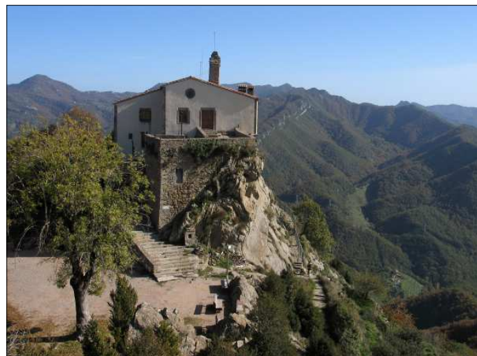
Santuari de Bellmunt des de la capelleta de la Mare de Déu de les Alades.