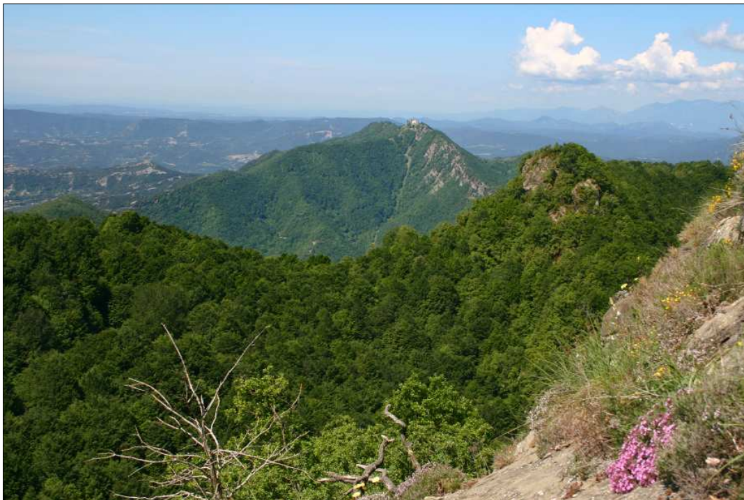
Serra de Bellmunt, amb el santuari al seu damunt, des de la serra de Curull. Fotos de Jordi Gironès.

formen un sol edifici de notables proporcions i d'aspecte de fortalesa.