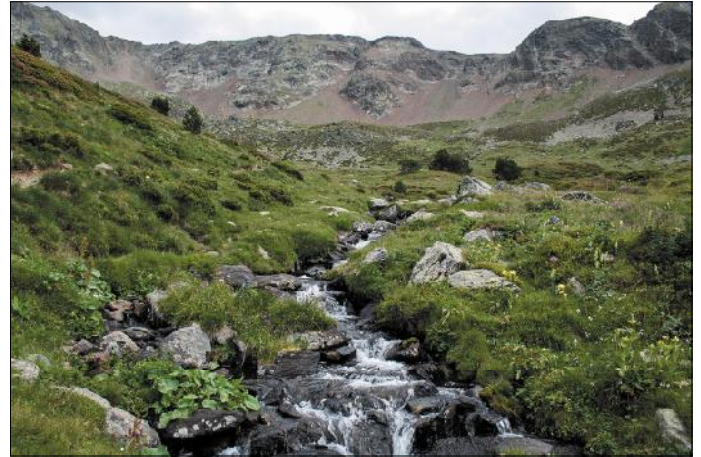
Circ de l'Estanyó