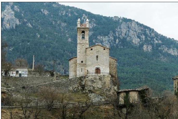
Nucli de la Pedra amb l'església dedicada a Sant Serni, al costat de la qual hi havia el castell.

Un altre fet que podem donar per segur és que s'hi desenvolupà la indústria llanera i que aquesta activitat fou important, com podem deduir dels Capítols de la Villa, així de la Mustaphaceria, com del Offici de la Pareyria y dels Teixidors ... de Sanct Llorenç dels Marunys , conjunt de normes per als teixidors i paraires de la vila redactats a finals del segle XIV o inicis del següent. També en el capbreu ordenat per Joan de Cardona el 1483 s'esmenten quatre molins bataners de draps al Monegal, partida de terra a tocar del riu Cardener i propera a la vila.