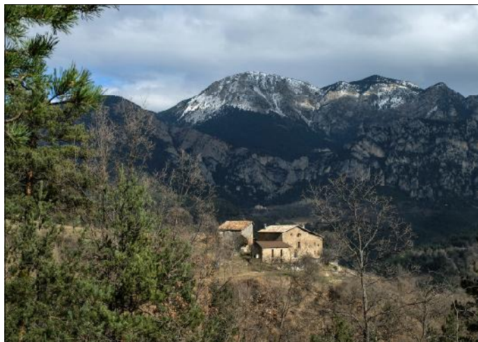
Casa dels Pasqüets amb l'ermita de Sant Cristòfol.

La llarga s'inicia a Sant Llorenç de Morunys (915) assolint les ermites de Santa Magdalena (1126) i Sant Cristòfol, davallant després fins al Cardener i anant a La Pedra (990), on hi ha l'església de Sant Serni i les restes del castell. Des de La Pedra, es puja als Joncarets i al coll del Jou (1.200) per iniciar el retorn a Sant Llorenç per Sant Lleir i el molí del Monegal. És un itinerari de 14 km amb un desnivell acumulat de 754 m. La curta s'inicia al mateix Sant Llorenç de Morunys seguint el GR 7 Cardener amunt per la font de la Puda fins a La Pedra per acabar a la carretera del coll de Port. És un itinerari lineal d'uns 7 km i d'uns 250 m de desnivell que es complementarà amb una visita turística prèvia a Sant Llorenç de Morunys.