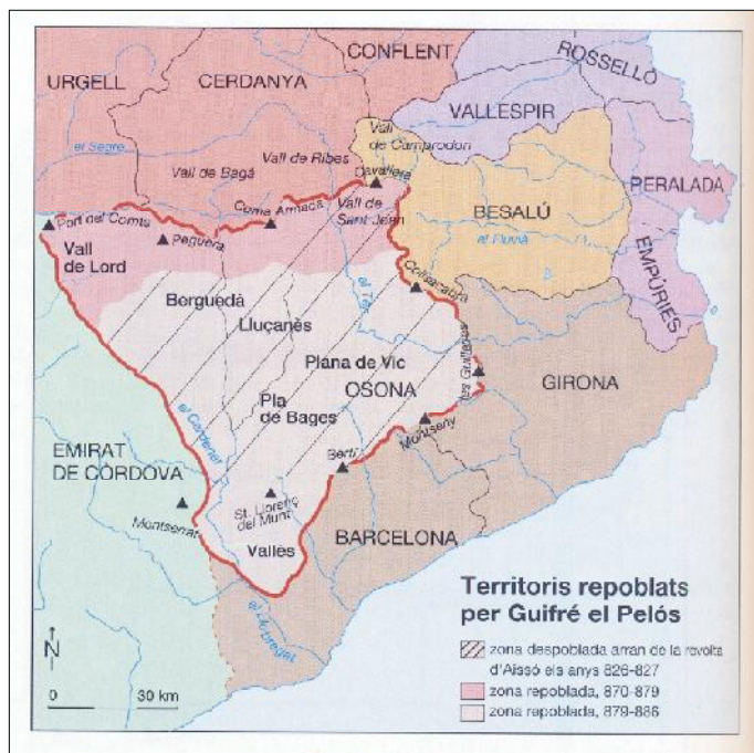
Zona repoblada per Guifré I. Atles d'història de Catalunya, Edicions 62

L'excursió d'avui està relacionada amb la conferència "Societat i poder" i més concretament amb el tema dels castells i les parròquies, que va ser la forma com el poder des dels temps altmedievals organitzava el territori i controlava la societat. Per veure-ho sobre el terreny anirem a la Vall de Lord per fer un recorregut que ens portarà a diverses ermites que havien estat parròquies així com a les restes d'un dels castells de la vall. El present escrit fa un breu recorregut per la història medieval d'aquest territori des de la seva estructuració en castells i parròquies, passant després pels monestirs que hi va haver i acabant amb unes pinzellades sobre l'aglomeració més important que s'hi formà: la vila de Sant Llorenç de Morunys.