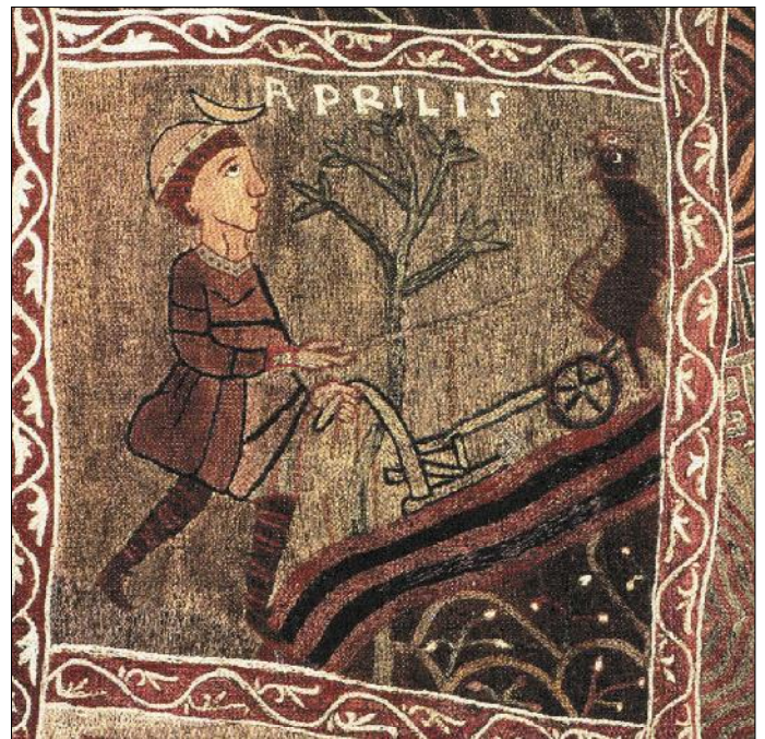
Pagès llaurant. Tapís de la Creació (Catedral de Girona).

deixant improductius els camps que fins llavors conreaven, amb la consegüent reducció de les rendes dels senyors. Per evitar-ho, es va incrementar la pressió feudal i l'adscripció a la terra, de tal manera que el pagès no podia abandonar el mas si no pagava al senyor una redempció.