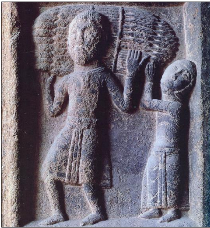
Pagesos portant garbes. Pòrtic del monestir de Ripoll.

Al segle XIV començà una crisi a causa de l'elevada mortalitat per les males collites, en especial l'any 1333 «lo mal any primer», i als brots de pesta de 1347 i 1351. Com a resultat, la població rural es reduí dràsticament, i, en una reacció en cadena, disminuï la terra cultivada, la producció i les rendes dels senyors. Per compensar aquesta reducció d'ingressos, els propietaris del camp (nobles, eclesiàstics i ciutadans) augmentaren la pressió sobre els pagesos amb l'exigència de tots els drets de caràcter feudal i senyorial. Al mateix temps, les ciutats, que també havien sofert una davallada de la població, oferien una forta demanda de mà d'obra. Per tal d'evitar l'emigració dels pagesos cap a les ciutats, on podrien tenir millors condicions de vida, els senyors van reforçar la vinculació dels pagesos a la terra amb una pujada del preu de les redempcions.