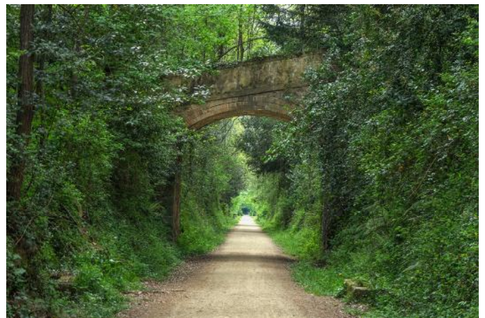
Via Verda d'Olot a Sant Feliu de Guíxols.