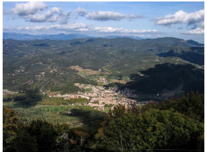
Sant Feliu de Pallerols des de la Salut.

A l'itinerari llarg el domini correspon a boscos espessos de roure martinenc amb fagedes a les zones més humides, destacant el bedollar que hi ha prop de la Salut. El bosc s'alterna amb pastures i conreus herbacis. A la curta hi ha boscos mixtos d'alzines i roures, i arran del Brugent hi trobem verns amb pollancre i plàtans. Pel que fa a substrat geològic trobem dipòsits i terrasses amb graves i sorres de l'Holocè amb alguns basalts a la zona baixa, mentre que a la zona alta de la llarga hi ha conglomerats, gresos i argiles de l'Eocè.