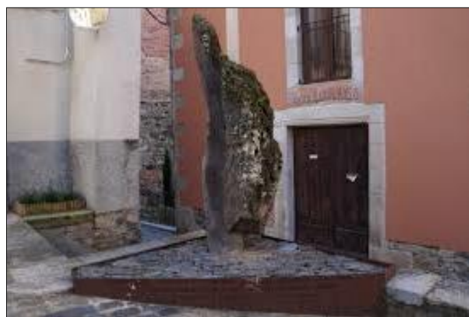
Monument a Francesc de Verntallat situat a la vila de Sant Feliu de Pallerols.

Mentrestant, Francesc de Verntallat i els seus remences mantenien una posició de força que els permeté negociar un compromís, signat en l'assemblea feta a Amer el novembre de 1485, per acceptar l'arbitratge del rei per resoldre el conflicte.