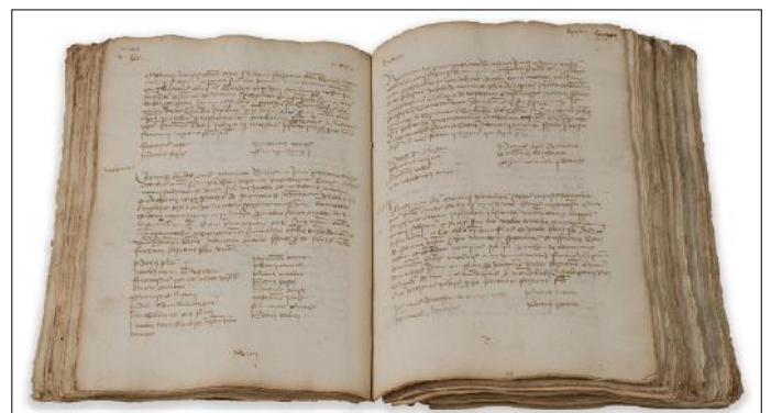
Llibre del Sindicat de Remença.

L'any 1450, els remences van presentar la seva demanda judicial davant de l'audiència reial. Malgrat la forta oposició de la Diputació del General, l'alta noblesa, l'alt clergat, i el Consell de Cent, el rei decretà una Sentència Interlocutòria suspenent provisionalment els mals usos i servituds fins que no s'arribés a un acord. Després d'una primera anul·lació, en fracassar l'entesa amb les Corts, la sentència fou confirmada l'any 1457.