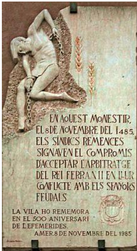
Placa commemorativa del Compromís d'Amer, Monestir de Santa Maria d'Amer.

per mas, una quantitat sensiblement inferior a les habituals a l'època.