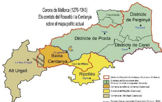
Rosselló i Cerdanya sobre mapa actual

dels Àustria. Després de gairebé dos segles de lluites contínues entre les dues potències la balança s'acabà inclinant a favor de França i del seu Rei Sol, el Borbó Lluís XIV, que segons una teoria geopolítica que li era cara cercava les fronteres naturals dels seus dominis.