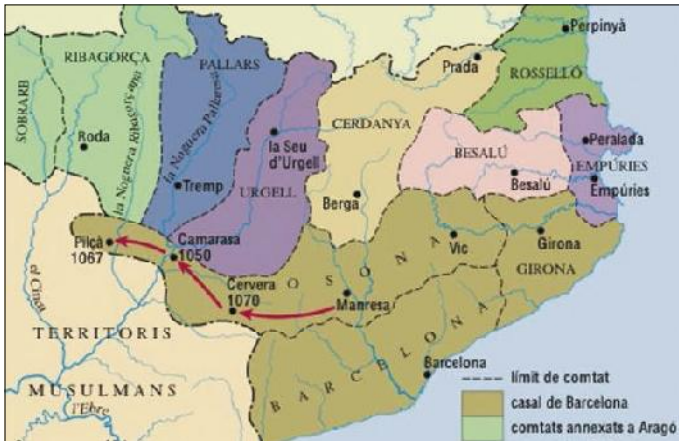
Els comtats catalans