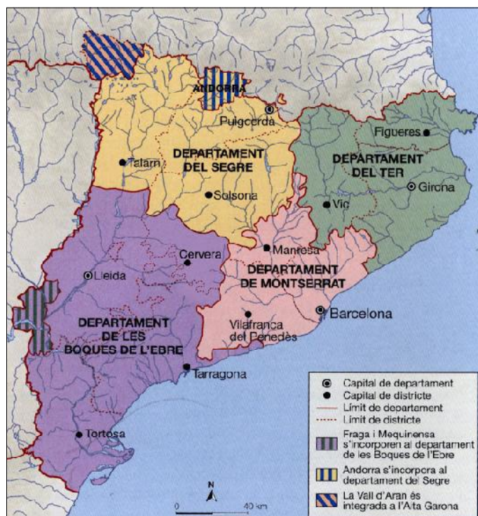
La Catalunya napoleònica, 1812.

El regne independent de Mallorca va durar encara no un segle; Pere el Cerimoniós va tornar-lo al tronc comú de la corona catalano-aragonesa el 1349 després d'una intervenció bèl·lica. Tanmateix potser aquesta separació dels comtats del nord de la resta de Catalunya va ser un mal precedent. Ens trobem que quan esclata la nefasta Guerra Civil catalana el 1462 entre la monarquia i la Generalitat el rei Joan II demana l'ajut del seu homòleg francès a canvi de cedir-li el Rosselló i la Cerdanya (tractat de Baiona) i no serà fins al tractat de Barcelona de 1493 que la tossuderia del seu fill, Ferran el Catòlic, aconseguirà que el rei francès d'aquell moment li retorni els comtats a canvi d'una teòrica neutralitat envers les