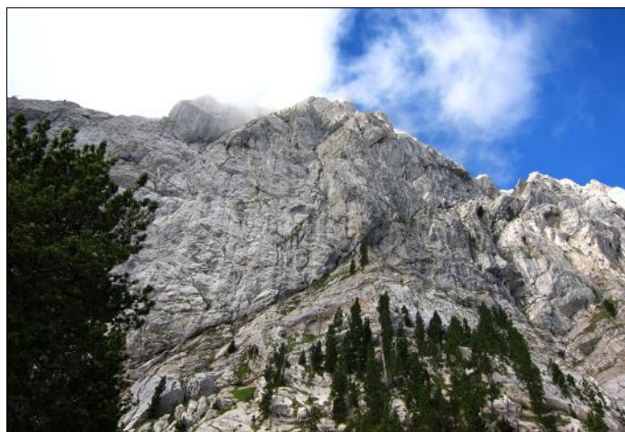
Paret nord del Pedraforca.

En fi, que això bull, aquesta gent ens porta anys d'avantatge, des de fa trenta anys cada temporada la seva revista, l'Alpine Journal, publica ressenyes de noves escalades de cims o parets verges. Això sí que és fomentar l'activitat!, i en canvi a nosaltres, si te'n