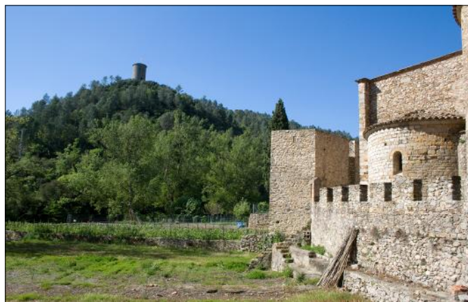
Sant Llorenç de la Muga.

La curta recorre la serra de Santa Magdalena, acabant al poble de Terrades amb 9,5 km i un desnivell de 348 m.