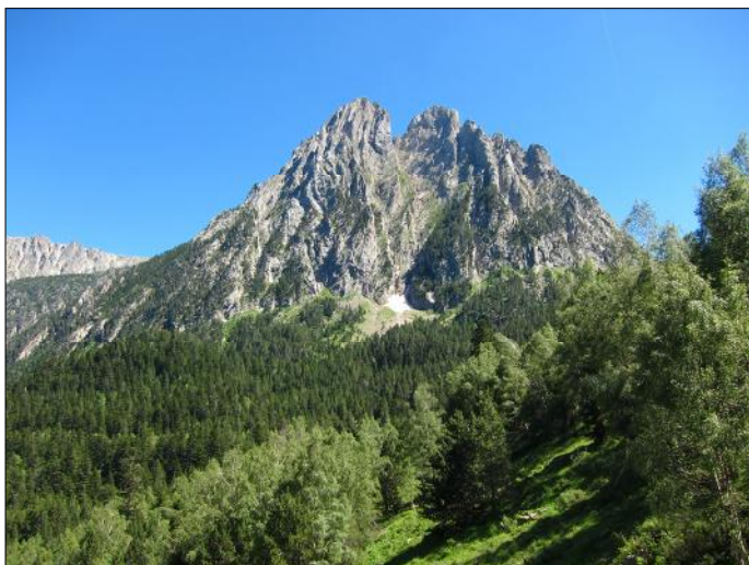
Els Encantats.

recordes, ens va costar un munt editar el nostre Butlletí ara farà tres anys!