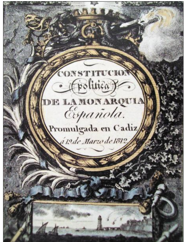
Constitució de Cadis

Ens trobem poc després amb la Guerra del Francès o de la Independència, de 1808 a 1814, amb l'ocupació estrangera de gairebé tota la Península. Com ja hem assenyalat abans, en el cas de la Guerra de Successió, no direm res d'aquest llarg conflicte perquè les batalles i altres fets de guerra succeïren, a casa nostra, a l'interior del Principat, no a la frontera. A més aquest episodi ha estat molt divulgat i és força conegut; potser no ho és tant el fet de l'efímera annexió de Catalunya a l'Imperi napoleònic el 1812.