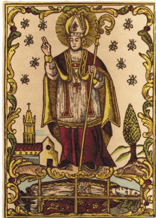
SANT NARCÍS PATRO DE LA CIUTAT DE GIRONA