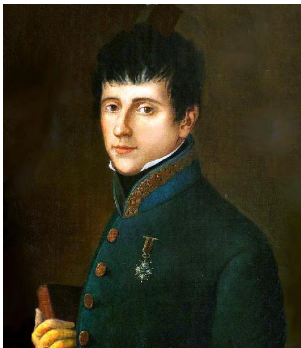
Rafael del Riego

Durant sis anys, de 1814 a 1820 —l'anomenat Sexenni absolutista—, hi va haver diferents intents de forçar el retorn a la constitució de Cadis. Aquests pronunciamientos , que era com es van anomenar aquests cops d'estat, van ser protagonitzats per militars d'idees liberals que s'aixecaven en armes contra el govern absolutista, però tots van fracassar fins que finalment el 1820 n'hi va haver un que va triomfar. Va ser el del general Rafael del Riego i gràcies al seu cop d'estat es va instaurar un règim liberal i de monarquia constitucional a Espanya per primera vegada a la història 1 .