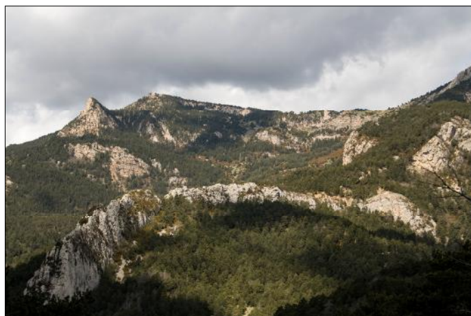
Roca d'Oró i Tagast des de la Figuerassa

La curta s'inicia al coll de la Creu del Cabrer (1.895 m) i acaba també a Espinalbet (1.178). Es tracta d'una davallada de 717 m amb un recorregut de 9,6 km, passant pel refugi dels Rasos de Peguera, per Sant Llorenç dels Porxos i pel pla de Campllong.