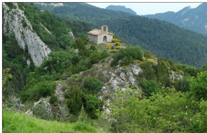
Sant Llorenç dels Porxos