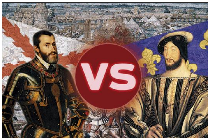
Carles V versus Francesc I

Hem d'arribar a l'edat moderna per tornar a trobar conflictes a les nostres fronteres. És quan el nét dels Reis Catòlics, l'emperador Carles, hereta la rivalitat del seu avi cap a la potència veïna. El rei francès d'aquell moment, Francesc I, a l'igual que Carles, era el prototipus de monarca renaixentista, ansiós de poder i glòria, dirimint les seves diferències al camp de batalla. Comença en aquest moment un estat de coses molt lamentable i enutjós per a la població, sobretot per a la pagesia, que durarà més d'un segle i que acabarà esclatant al Corpus de Sang. I és perquè en els regnats de Carles i dels seus successors —els Habsburg o Àustria hispànics— la guerra es tornarà a lliurar moltes vegades a la frontera catalanofrancesa. A tots els problemes que una confrontació bèl·lica comporta s'hi afegiran els provocats per l'allotjament forçós de les tropes espanyoles —mercenaris de procedències diferents— en casos particulars.