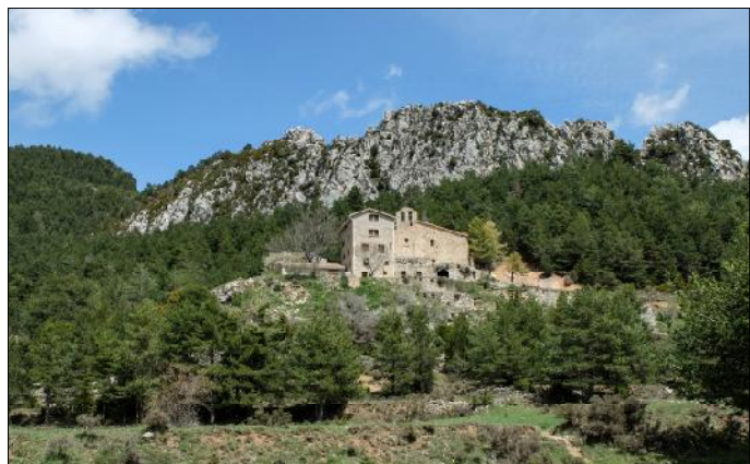
Sanatori de Corbera