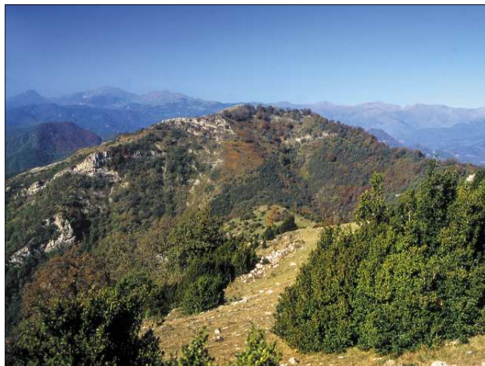
Puig Ou vist des del Talló.

Aquí es manifesta clarament l'ambient humit propi de la comarca d'Olot. Hi podem admirar la gran varietat arbòria del tipus de vegetació d'estatge muntà,