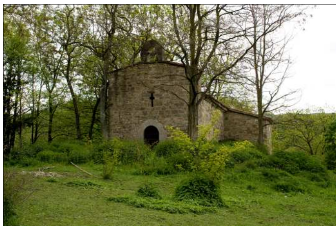
Ermita romànica de Sant Bartomeu del Sitjar. Data del segle XII, d'una sola nau i amb campanar de cadireta.