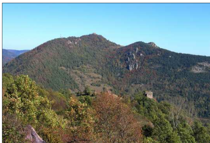
Sant Antoni de Camprodon des de la torre Cavallera.