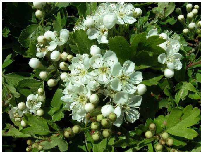
Arç blanc (Crataegus monogyna).

Com a curiositat, segons Coromines, l'original nom d'Ou aplicat a aquest puig provindria d'un Oau amb origen al nom d'Eudald, d'altra banda força corrent a la comarca d'Olot.