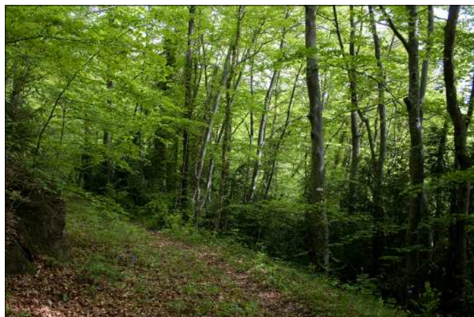
Fageda entre el Sitjar i Puig Ou.

L'excursió curta anirà també de Sant Pau de Segúries fins a Camprodon sense anar al cim del Puig Ou i en arribar a la collada del Sitjar farà camí al coll de l'Alec. El recorregut és de 13 km aproximadament amb un desnivell igual que l'excursió llarga, però amb menys quilòmetres, i es poden fer en unes 4 h.