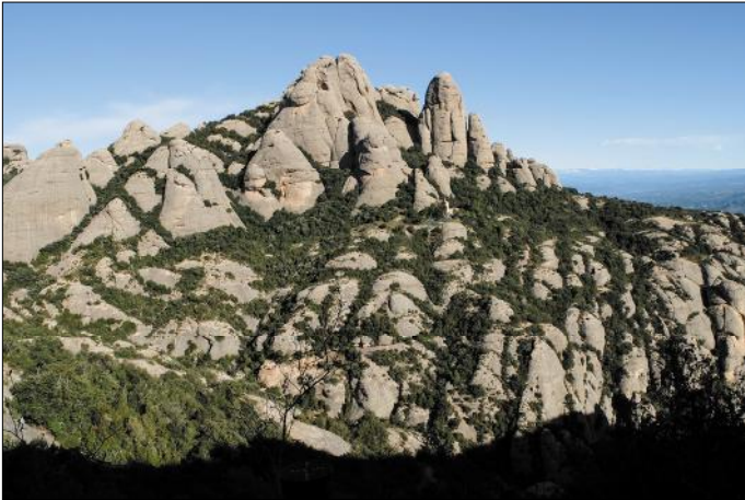
Regió de la Tebaida des del camí de Sant Joan a Sant Jeroni. Les fotos són de Jordi Gironès.

Itineraris circulars: des del monestir a St.Jeroni i des de l'estació superior del funicular de St.Joan