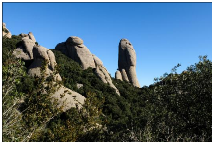
Cavall Bernat, per on passa el camí del serrat de les Lluernes.

L' ermita de Santa Anna pertany a la zona de Tebaida, al marge esquerre del torrent de Santa Maria (Vallmala). És l'ermita que es troba més a prop del monestir, al mateix peu del camí. En estar situada