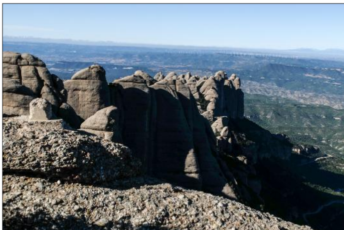
Regió d'Agulles des del cim de Sant Jeroni.

el Pebrot (1.069 m), la Carota (1.048 m) i trobarem l' ermita de Sant Salvador , pertany a la zona de Tebaida, està situada a l'extrem oriental del massís de Sant Salvador, al peu de la Roca de Sant Salvador i la trompa de l'Elefant, al costat de la Mòmia. Es troba al peu del camí del pla de la Trinitat a la serra de Lluernes per la cara sud. També és coneguda com l'ermita de la Transfiguració. La seva existència es troba documentada des dels primers anys del segle XIII. Hi ha una balma que formava part de l'ermita antiga i en construir-se la nova, la balma fou transformada en un oratori dedicat a la Nativitat del Senyor. L'edifici principal de l'ermita estava custodiat per uns immensos cons que s'aixecaven per tots costats simulant un niu d'ocells. L'any 1812 va ser destruïda per l'exèrcit francès, quatre anys més tard va ser restaurada i es va utilitzar fins al 1821, en què va ser abandonada. Romanen poques restes de l'ermita de Sant Salvador, aquestes estan embrossades i no es troben consolidades. Tot i això, es poden veure restes de murs de pedra, d'elements ceràmics, de passos, de terrasses i de murs de contenció. Des d'aquest lloc hi ha una bona panoràmica i es poden albirar altres ermites. A la balma hi ha una construcció moderna que està en ús. Per accedir a l'ermita de Sant Salvador hi ha unes escales des de Sant Benet amb corriol i desnivells. El camí no és recomanable per a un vianant no preparat, especialment el darrer tram.