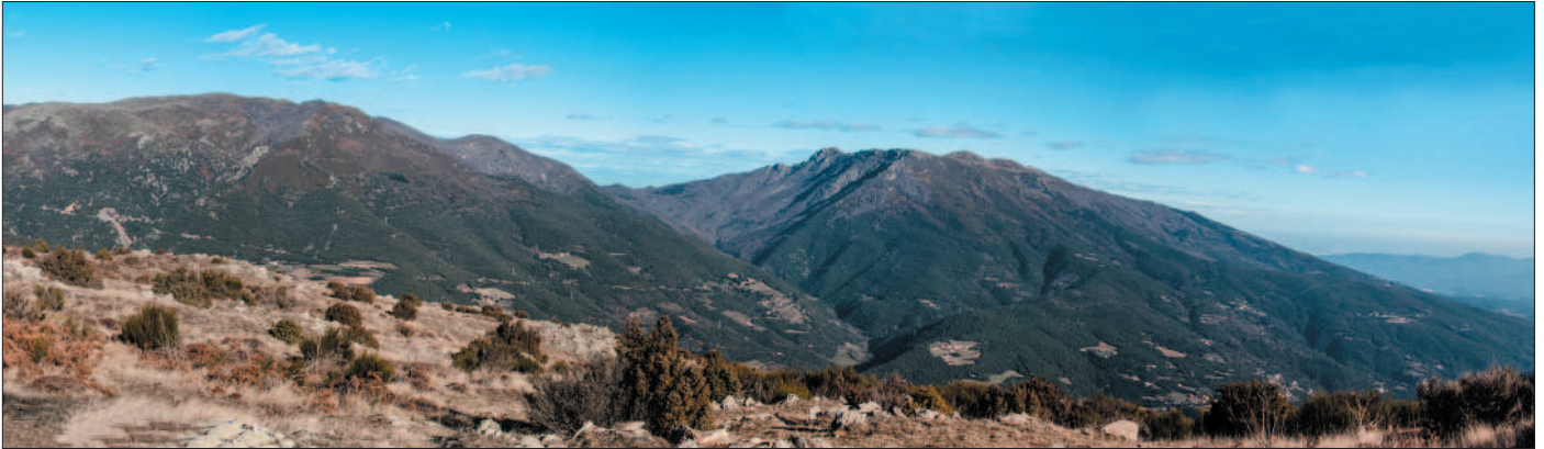
Matagalls, les Agudes i turó de l'Home des del Puig Drau.

El massís del Montseny amb el turó de l'Home, les Agudes i el Matagalls representa el punt culminant de la Serralada Prelitoral. Una sèrie d'importants fractures a l'est del Congost eleven els materials granítics i les pissarres paleozoiques donant lloc al Montseny i que gradualment s'enfonsa més a l'est cap a la depressió de la Selva.