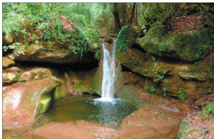
Riera de Martinet prop d'Aiguafreda de Dalt.