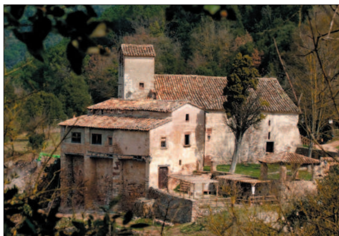
Aiguafreda de Dalt.