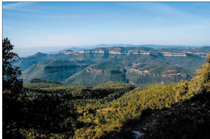
Cingles de Bertí des del Tagamanent.