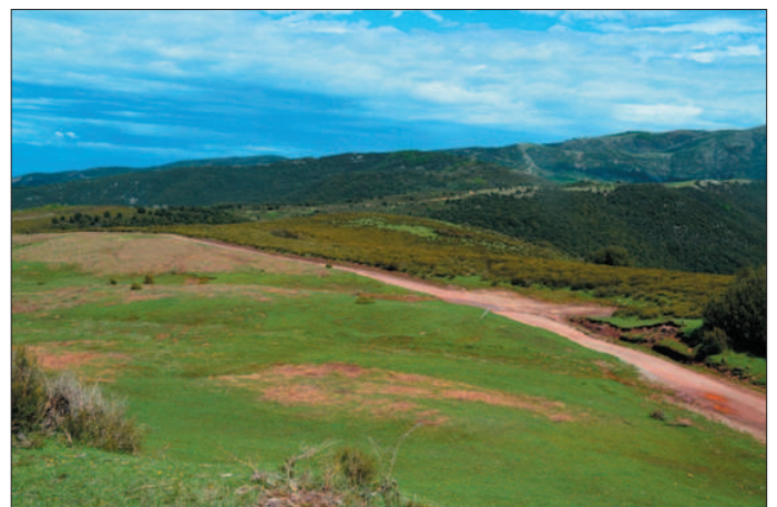
Pla de la Calma.

La Calma del Montseny representa les restes d'una d'aquestes peneplanes que arrasaren la serralada herciniana, que podem observar perquè una sèrie de fractures a l'est del Congost l'han elevat fins a la seva posició actual. Sobre aquesta peneplana hi queden restes dels materials gresosos i d'algunes calcàries del començament de l'Era Secundària. Els trobem sobretot en el turó de Tagamanent, on sobre els gresos rogencs hi ha un paquet de calcàries, que configura el turó. Però també trobem gresos rogencs sobre les pissarres i granits, dispersos aquí i allà en tota la Calma, com en el turó que hi ha sobre les runes del Cafè o pujant al Puig Drau.