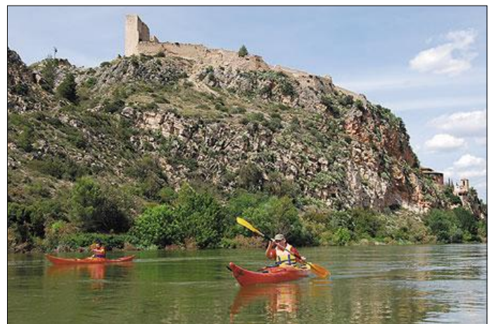
Per l'Ebre amb Miravet al damunt.

La Muralla de Finestres és una doble línia d'estrats verticals fruit d'un plegament, que contemplats conformen un paisatge realment extraordinari. Entre les dues línies d'estrats hi ha l'ermita romànica de Sant Vicenç (s. XI) i les minses restes d'un castell medieval.