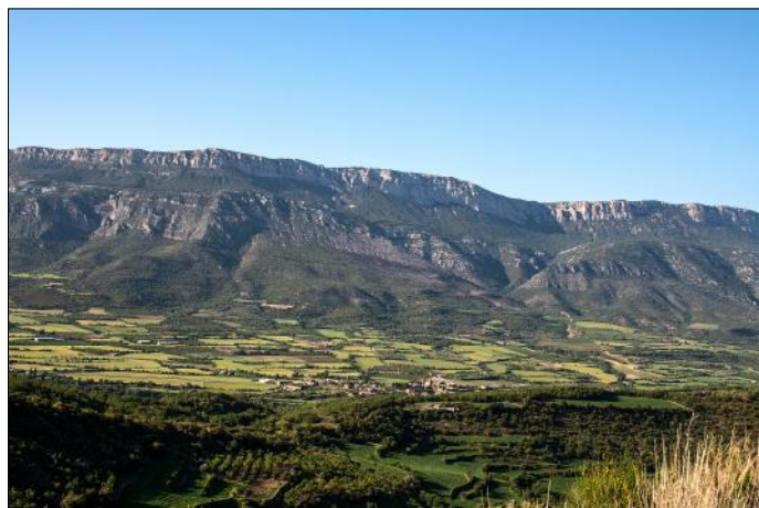
Serra del Montsec des del port d'Àger.

La curta anirà de Corçà a la torre de les Conclues (pantà de Canelles) retornant al mateix punt i amb un recorregut de 8 km i un desnivell de 200 m, i la llarga serà una circular des d'Àger pujant al port d'Àger i seguint la carena fins a les torres de Cas retornant a Àger per la Règola, amb un recorregut de 16 km i un desnivell de 435 m.