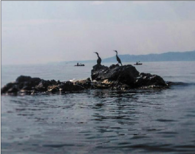
Corbs marins miren els caiacs passar.