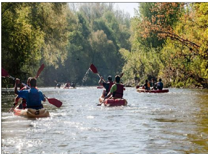
En caiac al riu Ter.

La primera part del recorregut transcorre pel congost de Fet i després es dirigeix a la Quadra de Blancafort. Són les restes d'un antic castell roquer que es construí aprofitant les balmes i forats naturals, protegint-los amb murs de pedra. Actualment, es poden observar alguns nius de voltors. Seguidament veurem davant nostre l'espectacular muralla de Finestres.