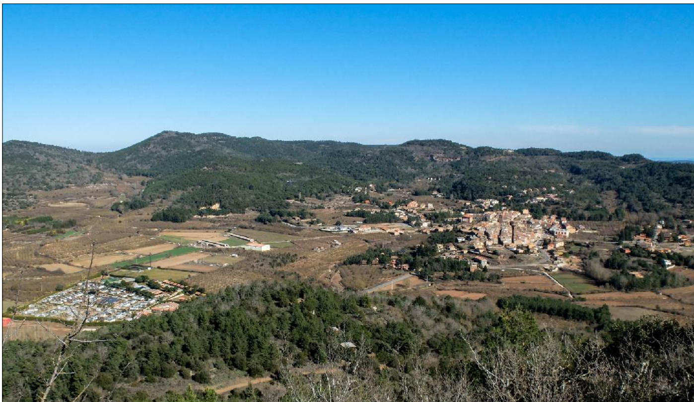
Panoràmica des del mirador del Pla de la Guàrdia, amb el tossal de la Baltasana com a cim més alt de les muntanyes de Prades, i la vila de Prades en el pla on s'ubica.

dilatades panoràmiques del Montsant (oest) i de les muntanyes de Prades (nord-est, est i sud), tenint en primer pla i al nord la serra de la Llena (923 m) i, darrere seu, el Pirineu si la visibilitat del dia en ho permet.