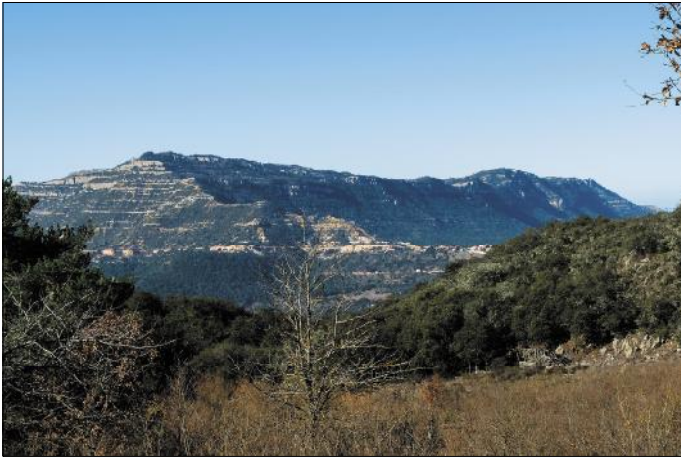
Serra de Montsant des del vessant oest de la serra de la Gritella.

La serra de la Gritella forma part del conjunt d'estructures tabulars que constitueixen les muntanyes de Prades i està situada a cavall entre el Baix Camp i el Priorat.