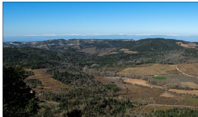
Serra de la Llena des del mirador del Pla de la Guàrdia amb el Pirineu nevat al fons