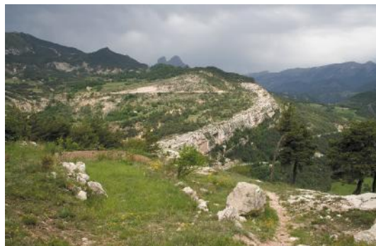
Cinglera de Vallcebre