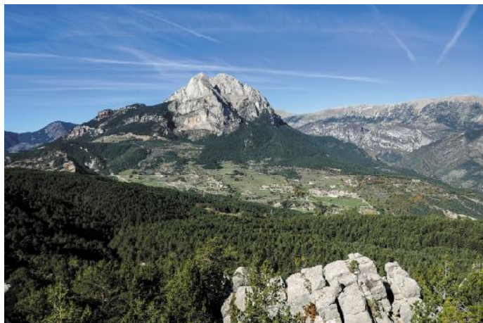
Pedraforca i Saldes des del mirador dels Graus