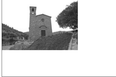
Ermita dels Sants Metges.

Tot just arribar-hi cerquem l'ermita dels Sants Metges. Bon nom penso, però prest em pregunto, eren els sants els qui