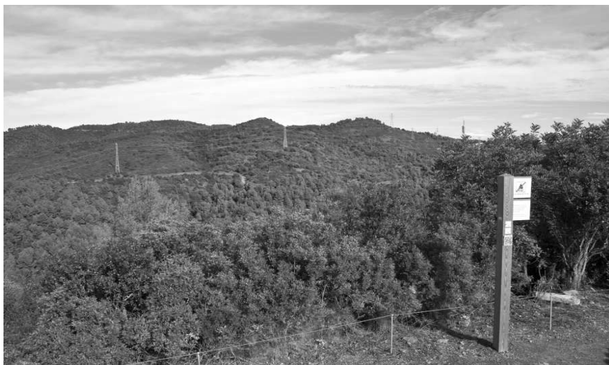
El PR-C 164 a la Penya del Moro amb el Turó Rodó i la Coscollera al fons.

El recorregut de Sant Feliu va rebre la denominació de PR-C 165 i tot i que no hi