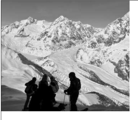
A Courmayeur, reposem forces contemplant el Glacier du Miage (Massís del Mont Blanc).

del Mont Blanc és prou gran per a tots. En un quart d'hora, si fa o no fa, superem un desnivell de gairebé 3.000 m. Fa esgarri-far només de pensar-hi. Som dels primers en arribar a l'Aiguille du Midi (3.842 m), però els nostres guies, que ja n'han vist de tots colors, ens deixen temps per a fotos i contemplar les vistes espectaculars des dels diversos miradors: si a algú li ha d'agafar mal d'alçada, millor que sigui ara, abans de trepitjar la neu. El cim del Mont Blanc queda tapat per alguns núvols tossuts, però davant els nostres ulls podem contemplar una immensitat blanca, que ens espera serena (nosaltres no ho estem gens, de serens). Més enllà, cap al sud, cims mítics dels Alps italians. Als nostres peus, Chamonix convertit en una maqueta de joguina. A l'estiu funciona un telecabina que du des d'aquest punt fins a la Punta Helbronner (3.462 metres), ja en territori italià, tot voleiant pel damunt de les glaceres. Una experiència molt recomanable.