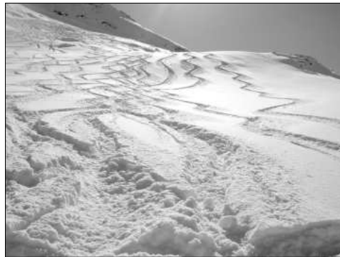
Traces, traces, traces.

El diumenge paguem la tarifa del túnel del Mont Blanc, al seu costat, la del túnel del Cadí sembla irrisòria: 52 euros en cada sentit! Sort que anem en un minibus de 9 places i la guia Cécile té una targeta de descompte (una de les 15 guies femelles, entre un univers d'uns 500 guies a França, tot un privilegi i un caràcter terrible). Aquí, a Courmayeur, hi ha molta menys gent i els guies ens menen per bon camí. Arribats a la Cresta Youla, fitant la