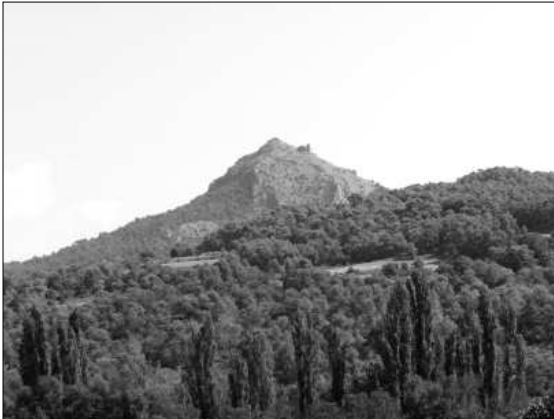
Visió del Montmagastre des de ponent.

tre cap a on ens dirigirem. Uns sis-cents metres abans d'arribar al petit nucli poblacional, de fet quatre cases mal comptades, aparcarem sota cal Donzell i iniciarem el camí de pujada per una pista que mena a cal Badia, masia la qual deixarem a l'esquerra per seguir durant uns tres-cents metres més la pista que de cop i volta desapareix enmig d'un camp. Seguim per aquest camp, sempre vorejant-lo per l'esquerra, i atents a un corriol ben marcat que al poc apareixerà entre la vegetació. Un cop localitzat el sender, a mesura que anem pujant podrem escollir entre anar de dret cap al magnífic edifici que fa estona ens observa damunt nostre, o bé seguir mig embardissant-nos per anar a veure les ruïnes de l'antic poble. No cal dir l'opció que nosaltres vàrem escollir: les bardisses. Des d'aquí i trespant entre les pedres de les cases enrunades i els troncs de les heures que les bressolen, vàrem tornar a trobar un corriol que ens duria, ara sí, a la canònica de Sant Miquel de Montmagastre.