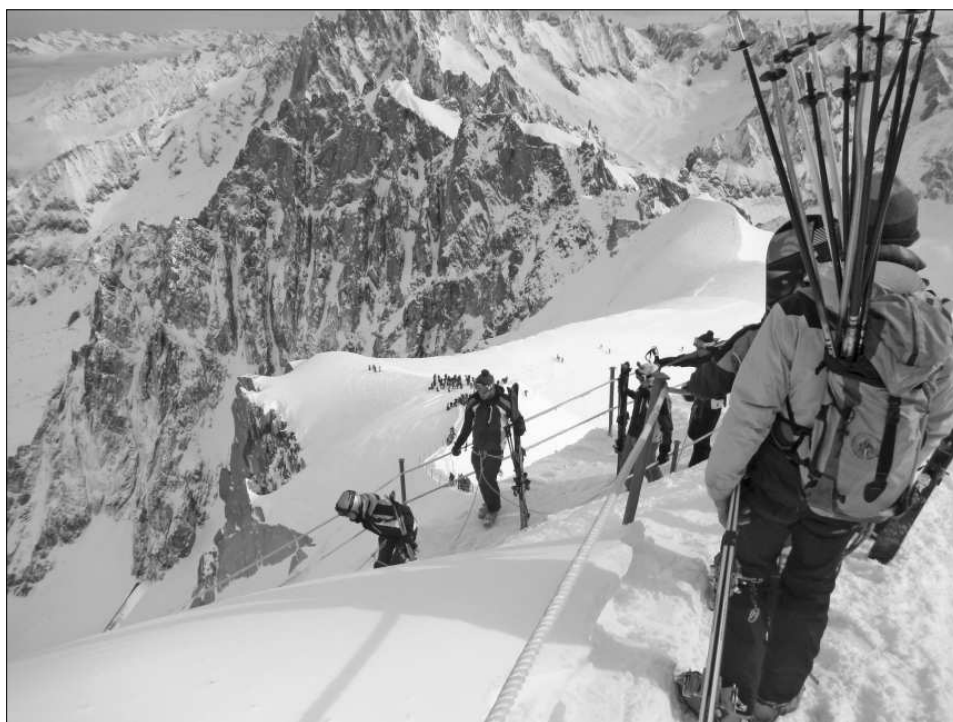
Sortint de l'Aiguille du Midi, amb el massís del Mont Blanc als nostres peus.