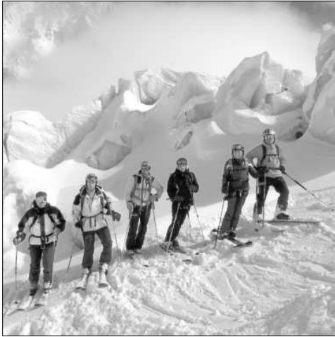
Les esquerdes d'Altra Món d'Argentières.

el dia i el cel segueix serè quan es fa fosc. Compres a Chamonix, tafanejar una mica, estirar les cames, a sopar i a dormir.