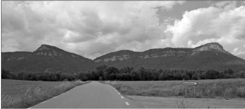
Panorama dels cingles: esquerra Malla, dreta Sant Salvador.

nosaltres veient-nos sempre tocant de peus a terra? Diuen, pobrets humans!