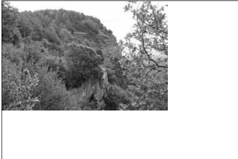
Espadats de Sant Salvador.

Superat el gros graó i ja a 1.000 metres d'alçada, el sotabosc es torna prat de pastura. Entremig de les vaques abastarem el conjunt de Sant Salvador: les restes d'una molt antiga ermita que duu el mateix nom del sant, un vèrtex geodèsic, una senyera majestuosa voleiant lliure al vent i un espectacle tret de la paleta del millor artista pintor. Sota nostre un calidoscopi de coloraines tot emmarcat per voravius d'arbres i matolls. Camps amb verds clars i foscos i violacis, ocres gairebé grisos dels rostolls de vells sembrats i ocres lluenters per l'acció del pas recent de l'arada, marrons de tot l'escalat i figures de pessebre escampades arreu. Sobre els nostres caps una negra massa de núvols que es deixava esqueixar ací i allà per donar-nos matisats raigs de sol que avivaven les tonalitats. Un plaer.