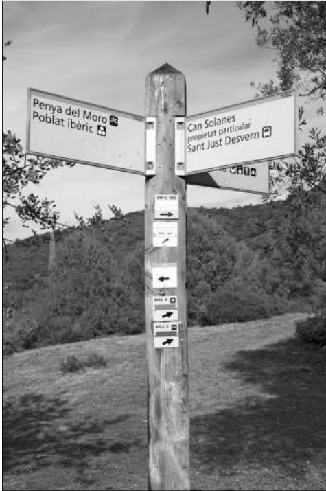
Pal situat al coll de Can Solanes amb indicacions dels diversos indrets i camins senyalitzats, entre ells el del PR-C 164.

va haver cap contacte ni acord amb el GEPS, per raons purament geogràfiques ambdós itineraris tenen algun tram coincident entre la Penya del Moro i el puig de la Coscollera, essent perfectament complementaris abastant el perímetre comprès entre Sant Feliu, Santa Creu d'Olorda, coll de les Torres, turó d'en Corts, Sant Pere Màrtir, Sant Just i la Penya del Moro, fent possible combinar diversos itineraris de diferent durada.