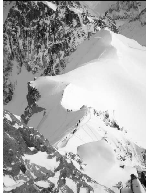
La carena de sortida de l'Aiguille du Midi.

A l'hivern o a l'estiu, val la pena venir aquí. A buscar la traça, a ser testimoni d'un panorama corprenedor, magnífic, monumental. No tenim res més gran en aquesta part d'Europa. Des del mateix poble de Chamonix, a poc més de 1.000 metres d'alçada sobre el nivell del mar s'albira l'Agulla del Migdia il·luminada a l'albada, enfilada al cap d'amunt d'una paret vertical de pedres i arbres i neu,