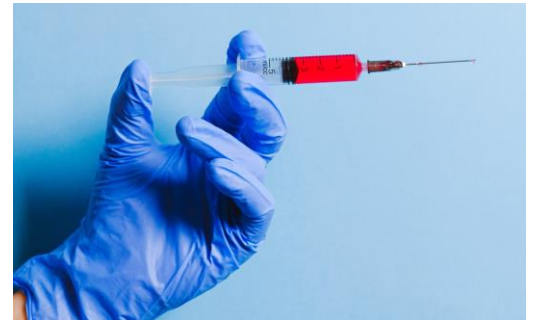
Casos d'eutanàsia a Holanda

- A Holanda l'eutanàsia s'ha incrementat més del 400% en 18 anys, de 1.815 a 7.666.