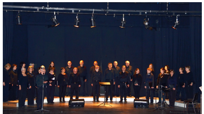
Actuació de l'Orfeó en el Musicoral 2017.

Per motius de coordinació de tots els intervinents, el concert se celebrarà uns dies abans de l'inici "oficial" del període de celebració. Serà a la Sala Gran el dia 11 de juny de 2017, diumenge, a les 7 de la tarda.