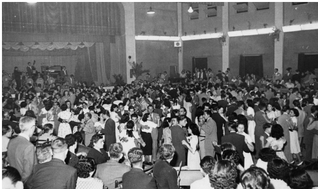
Ball a la Sala Gran, escenari del sopar Foto Arxiu Ateneu.

Ja hem dit que tot va començar amb un sopar, doncs bé, oficialment el Centenari també el començarem amb un sopar. Serà el dimecres 28 de juny, a les 9 de la nit, a la Sala Gran. La primera intenció era de fer un sopar d'època, on els assistents haguessin d'anar vestits a l'estil de 1917, però de seguida es va veure que això seria impossible i s'ha substituït per un sopar de gala. Per tant es demana als assistents que vagin vestits elegantment.