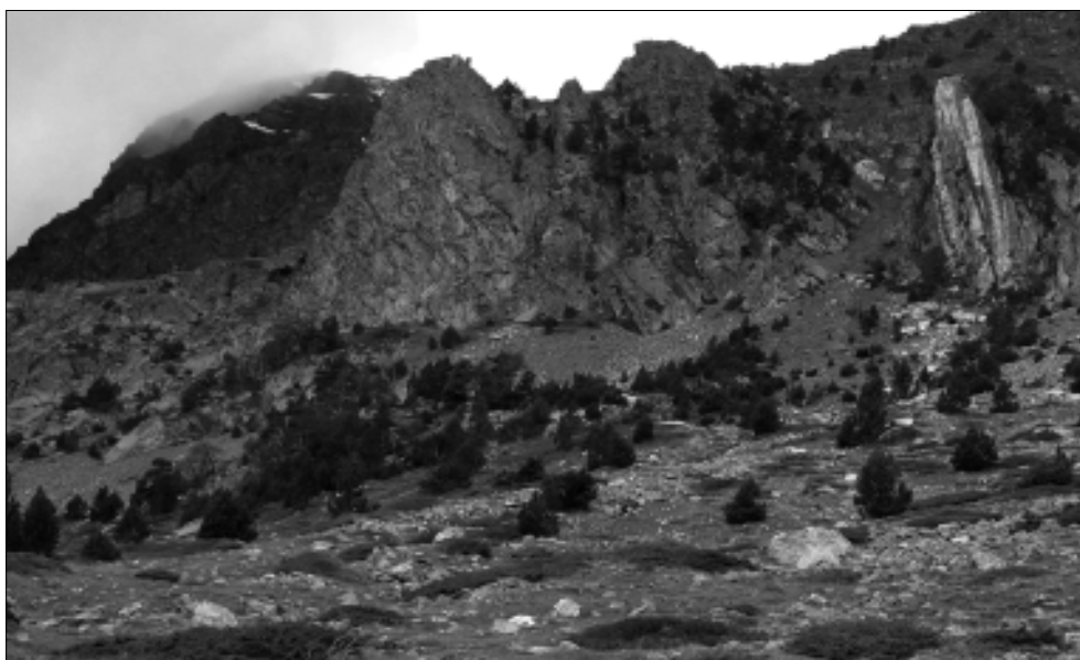
Visió de la Punta SEAS des del Pla dels Bocs.

quil·la i bonica vall del Pirineu, i precisament perquè és un lloc tranquil i poc freqüentat hem tingut l'oportunitat de poder batejar aquesta roca amb el nom de la SEAS. Per altra banda, les seves característiques ens han semblat idònies perquè, i això per mi era de molta importància, tot aquell soci de la SEAS que ho desitgi podrà pujar-la pel fet que tant es pot escalar per la seva via com per la canal de l'esquerra, i fins i tot caminant tranquil·lament per la canal de la dreta o anar ascendint pausadament, voltant-la i salvant les petites muralles de roca per la seva esquerra en una tranquil·la i agradable excursió.