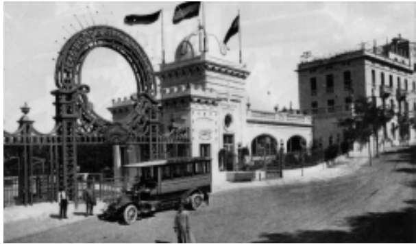
El casino de la Rabassada.

A finals del segle XIX neixen a França els casinos. El govern francès restringeix els jocs d'atzar. Tant sols es permeten als casinos de determinades estacions balneàries, termals o climàtiques. El casino de la Rabassada es construeix pràcticament en aquesta època, a principis del segle XX (per cert, durant molt de temps s'ha escrit Arrabassada, però els experts han decidit que s'ha d'escriure La Rabassada, nom que probablement deriva del mot comú rabassa, que significa «part baixa de la soca dels arbres i arbusts»).