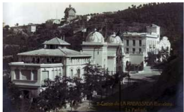
Façana del casino.

Avui, del Casino de La Rabassada només en queden ruïnes, envoltades d'alzines, rouredes, pins, rèptils, ocells, porcs senglars, etc. La natura ha guanyat definitivament la partida.