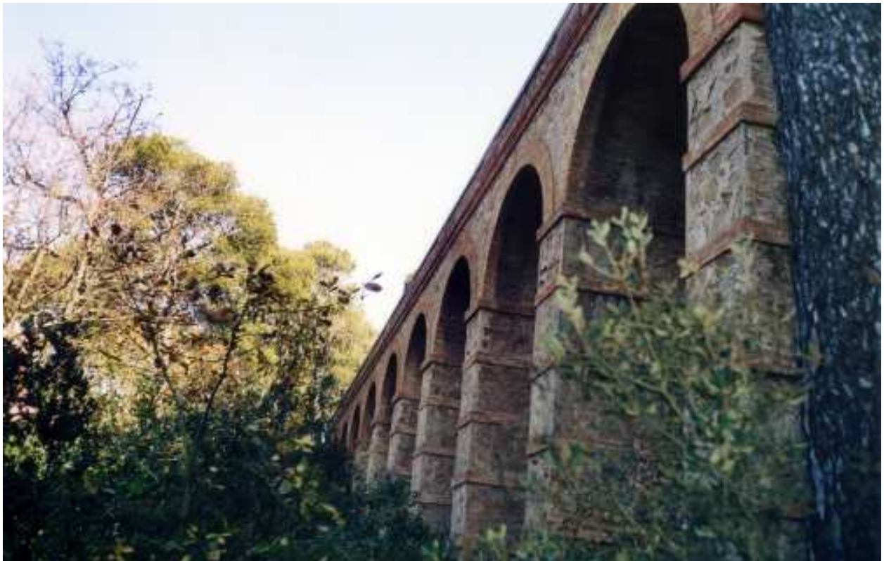
Viaducte de can Ribes.

La vista sobre el Tibidabo és magnífica, i cap a l'est es veuen la zona de la font Grogà i la vall de Sant Medir. Però la millor panoràmica és cap a l'oest, on es domina des del torrent de La Rabassada fins a les ciutats vallesanes de Sant Cugat i Rubí i, al fons, la muntanya de Montserrat.