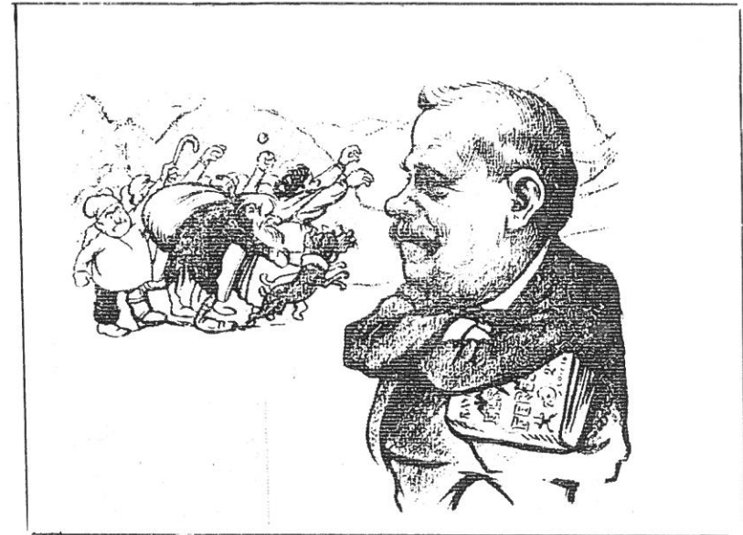
Raimon Casellas caricaturitzat junt amb els seus personatges d'Els sots feréstecs.