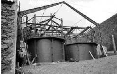
Imatges de la fàbrica procedents de la documentació dipositada avui a Poblet