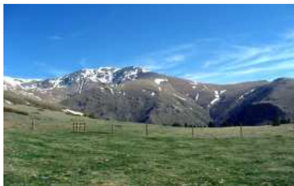
Massís del Puigmal vist des del Roc Blanc, situat molt a prop del coll de les Barraques.

Al coll de les Barraques hi ha unes excel·lents vistes del proper massís del Puigmal amb un paisatge que alterna els prats amb les pinedes de pi roig. A partir d'aquest punt el camí davalla fins al riu de Tosa on trobarem la font de l'Home Mort (1.806 m). En aquest lloc hi conflueixen el camí de Fontalba (variant 8 del GR 11) i la pròpia GR 11 que és la que seguirem tot davallant en direcció est fins a Queralbs (1.201 m) passant per sota els cingles de l'Andreu.