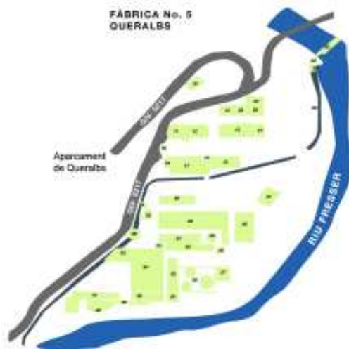
Fàbrica de Queralbs

Tema: Indústries de guerra. Al final de l'excursió, a la Farga de Queralbs, visitarem l'emplaçament de la Fàbrica F-5 que es convertí en un centre de fabricació de gasos tòxics durant la guerra 1936-39. Avui, però, només subsisteixen alguns edificis d'aquell moment. En aquests moments l'indret acull una casa de colònies.