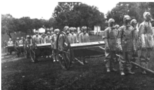
Unitat de lluita contra gasos, equipada al complet, de l'exèrcit franquista. Fotografia de 1937.

Barcelona, però va ser detingut de nou per les noves autoritats el mes de febrer. Un consell de guerra el condemnà a vint anys i un dia de reclusió per adhesió a la rebel·lió, i no va sortir en llibertat condicional fins a l'any 1944.