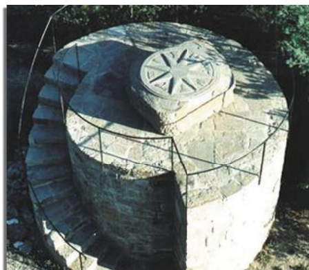
Rosa dels Vents situada en el centre geogràfic de Catalunya.

El camí de pujada és de 1 h 30 min i la baixada d'1 hora.