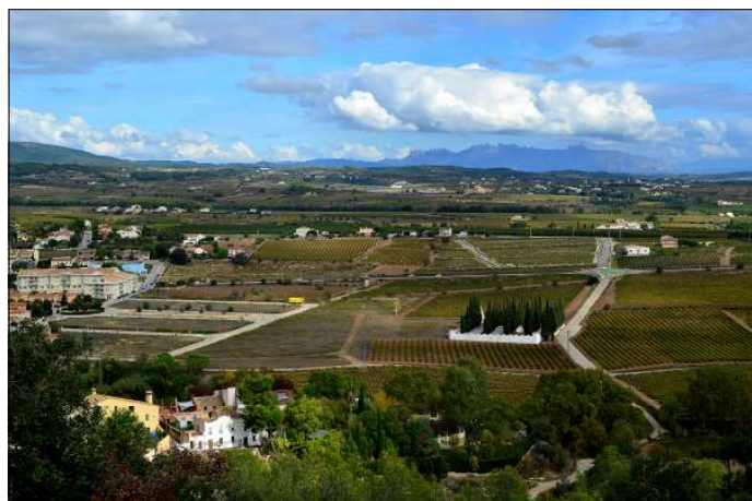
Vinyes i Montserrat des de Sa Roca.

Una excursió amb un aire una mica aventurer, però sense grans dificultats. Per accedir a les balmes hau-