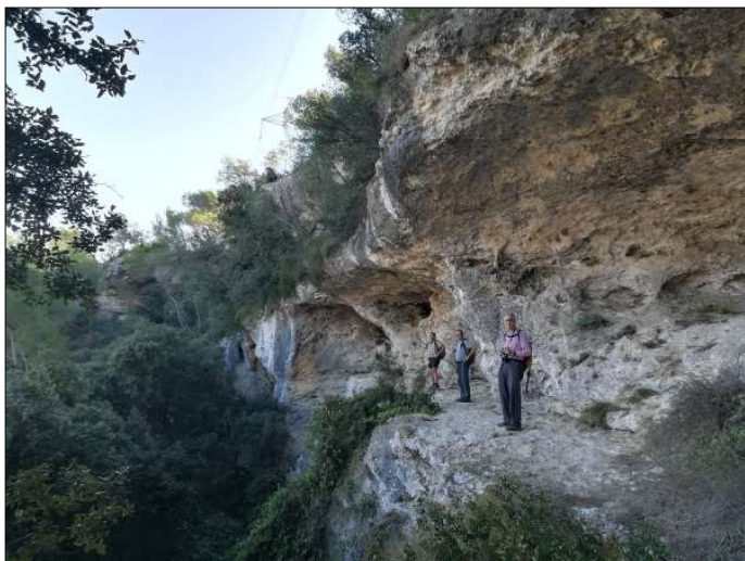
Les coves de Sant Martí Sarroca.

monis que s'emmarquen en el moviment repoblador d'aquestes terres de frontera.