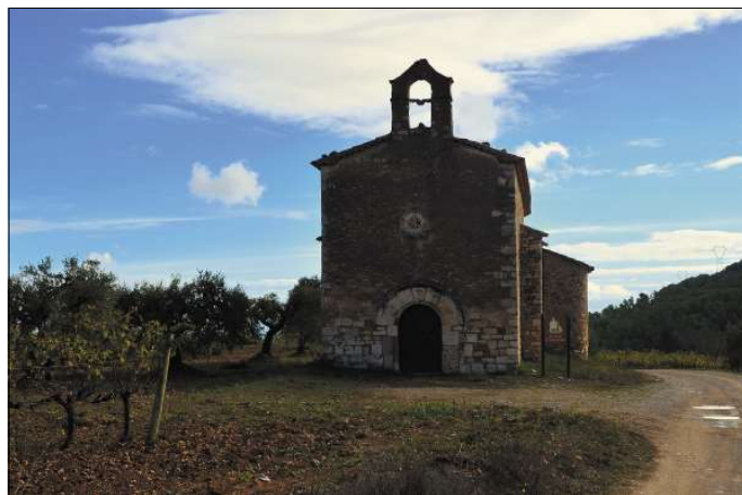
Sant Joan de Lledó.

Està ubicada en un entorn rural de conreu de vinya que de ben segur va ser testimoni mut de conflictes entre els remences, de contractes de rabassa morta, de l'aparició de la fil·loxera... però també de la prosperitat dels seus habitants, de creixements demogràfics, de canvis... Sant Joan de Lledó és una petita església d'origen romànic, la fàbrica de la qual ha estat modificada al llarg dels anys. És un dels múltiples testi-