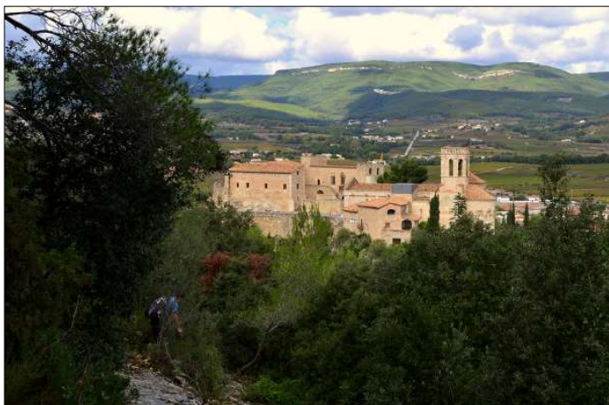
Sant Martí Sarroca des de les coves.

És una capella d'una sola nau rectangular amb una edificació lateral afegida, la sagristia, que té forma d'absis preromànic. Té contraforts laterals i absis sobrealçat, amb una finestra romànica, en època barro-