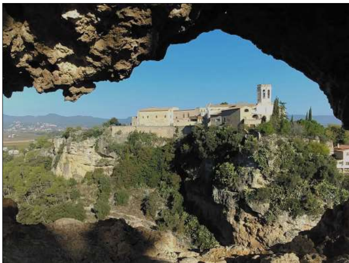
Església i castell de Sarroca des de les coves.