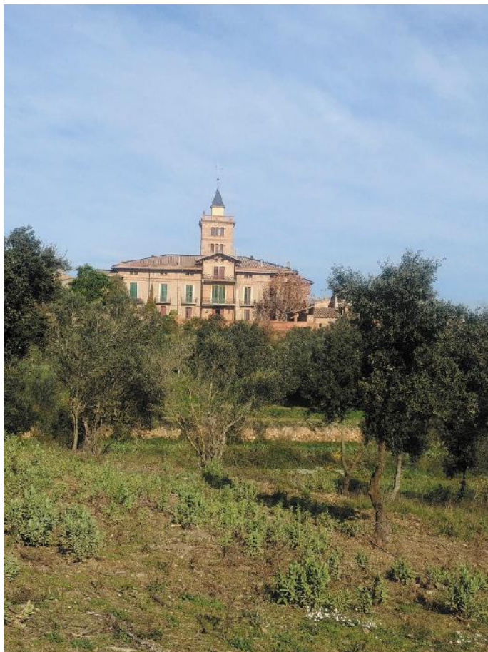
Can Montmany.