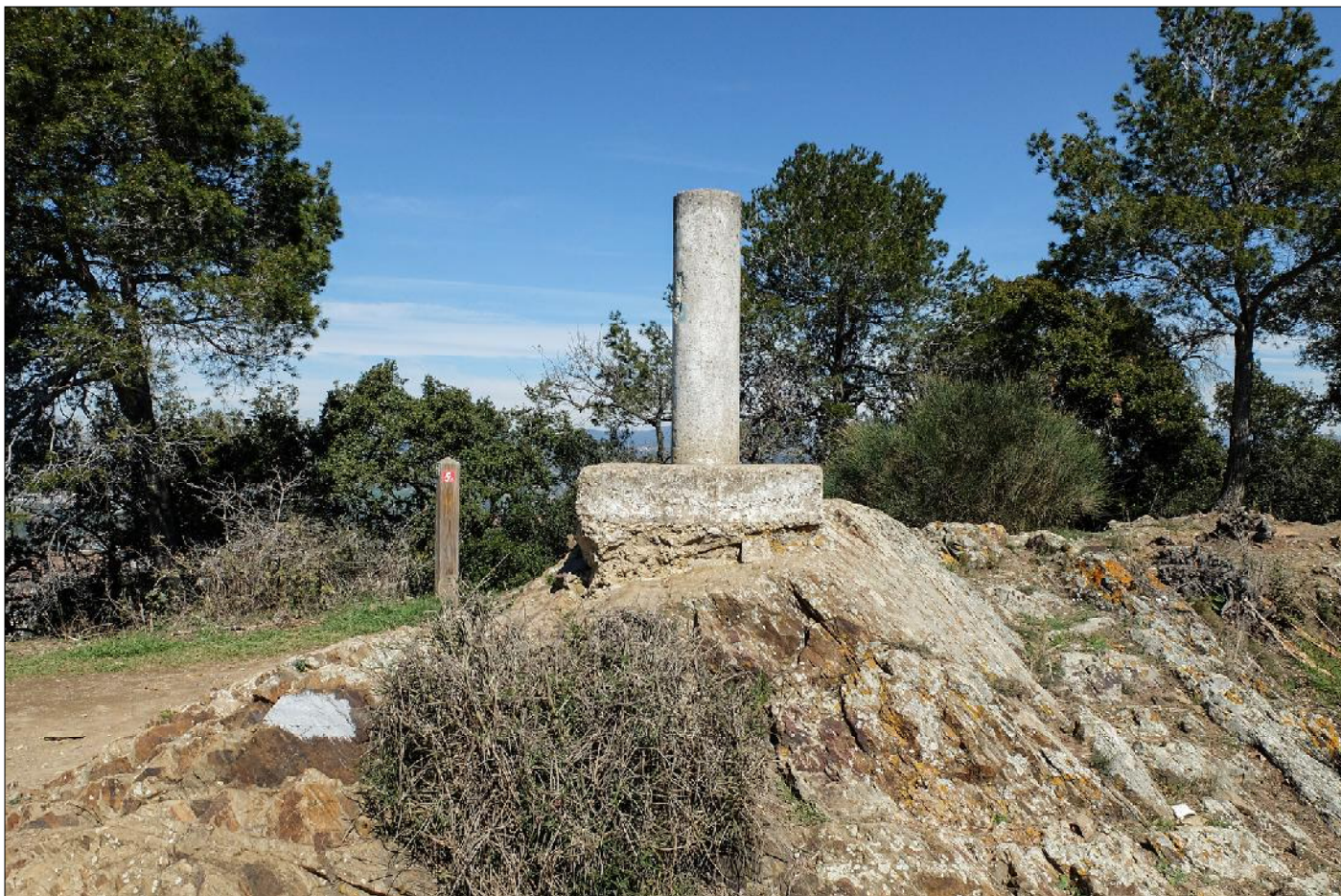
Cim del puig Madrona.

en un primer moment era de nau única, amb possible capçalera quadrangular i una coberta de fusta que data del s. X. En una ampliació al s. XI s'hi afegí una capçalera triple amb un absis semicircular i dues absidioles als laterals, una volta de canó amb arcs faixons i s'amplià la nau que esdevingué més llarga i, possiblement, més alta.