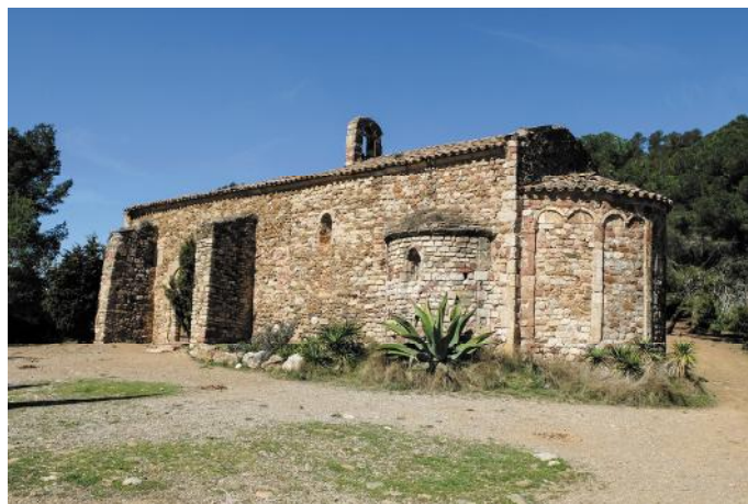
La Salut del Papiol.

És una construcció senzilla, amb molt poca decoració, però amb un estat de conservació excel·lent. L'edifici