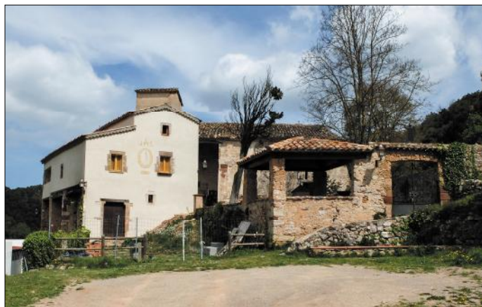
Aiguafreda de Dalt.