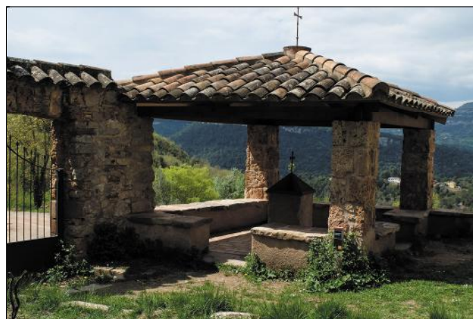
Comunidor d'Aiguafreda de Dalt.

Actualment s'hi du a terme un projecte de recuperació que inclou recerca històrica i arqueològica, estudi geotècnic, estudi de patologies, etc., dirigit a la rehabilitació del conjunt monumental com a destinació cultural i turística.