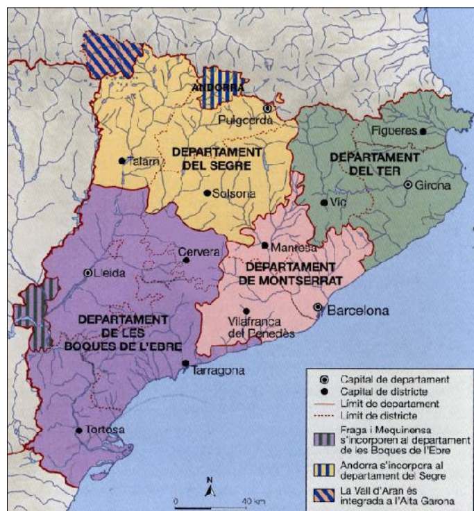
La Catalunya napoleònica, 1812.

El regne independent de Mallorca va durar encara no un segle; Pere el Cerimoniós va tornar-lo al tronc comú de la corona catalano-aragonesa el 1349 després d'una intervenció bèl·lica. Tanmateix potser aquesta separació dels comtats del nord de la resta de Catalunya va ser un mal precedent. Ens trobem que quan esclata la nefasta Guerra Civil catalana el 1462 entre la monarquia i la Generalitat el rei Joan II demana l'ajut del seu homòleg francès a canvi de cedir-li el Rosselló i la Cerdanya (tractat de Baiona) i no serà fins al tractat de Barcelona de 1493 que la tossuderia del seu fill, Ferran el Catòlic, aconseguirà que el rei francès d'aquell moment li retorni els comtats a canvi d'una teòrica neutralitat envers les aspiracions franceses a Itàlia.