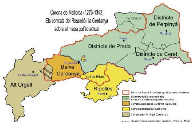
Rosselló i Cerdanya sobre mapa actual

tes contínues entre les dues potències la balança s'acabà inclinant a favor de França i del seu Rei Sol, el Borbó Lluís XIV, que segons una teoria geopolítica que li era cara cercava les fronteres naturals dels seus dominis.