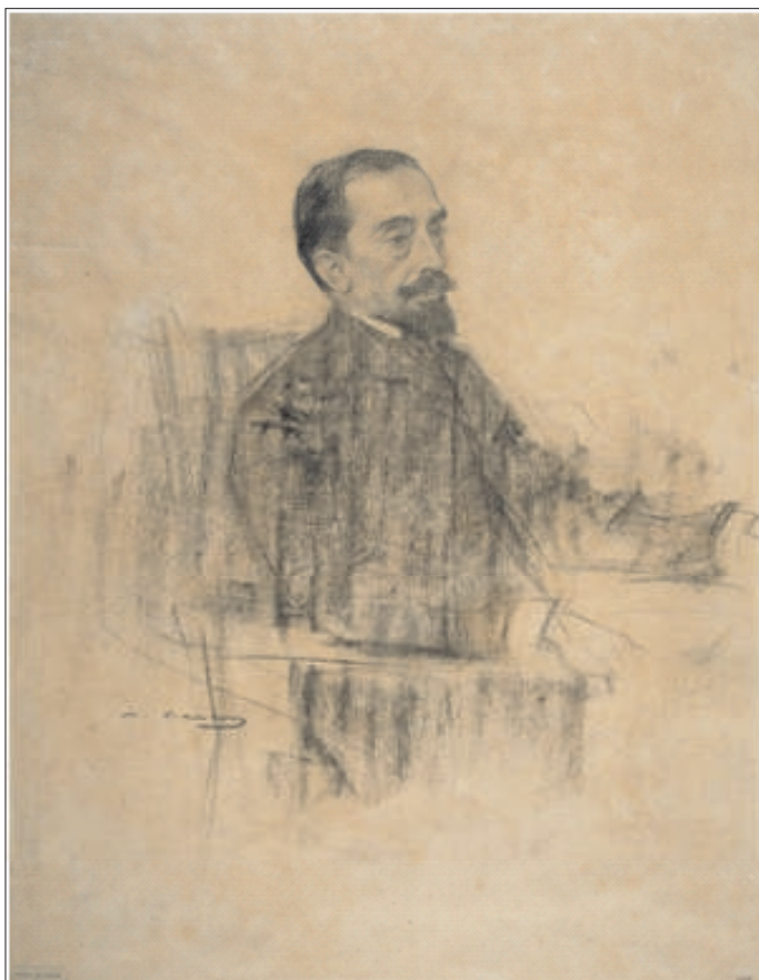
Joan Maragall per Ramon Casas.