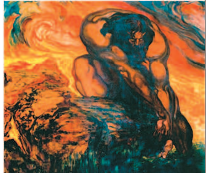
Néstor Martín-Fernández de la Torre, Hércules amasando el túmulo de Pirene (1909).

Més endavant, al capítol anomenat La descoberta de la muntanya , descriu en profunditat el paper del món excursionista en l'aventura que representa endinsar-se en aquest món desconegut de la muntanya: [Quan els habitants de la terra baixa penetren en els territoris