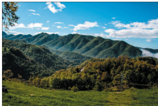
Serra de Curull des de Vidrà.

Excursió curta: Santa Maria de Besora, el Mir, salt del Mir, el Prat i Santa Maria de Besora. L'itinerari és de 9,5 km amb un horari previst de prop de 4 h, i amb un desnivell de 300 m que es baixen i es pugen.