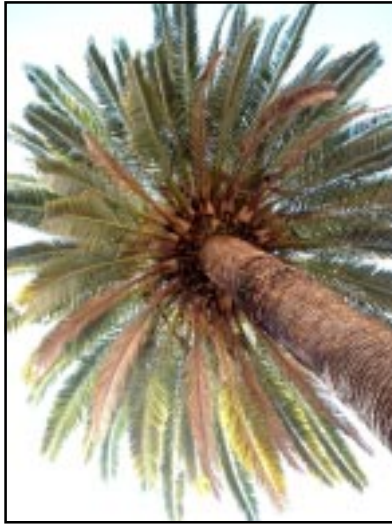
La palmera de can Carbonell